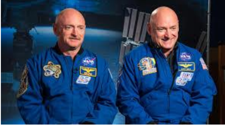
*Sağdaki Scott ve soldaki de ikiz kardeşi Mark*

Genelde, astronotlar Uluslararası Uzay İstasyonu'na altı aylığına yollanırlar. Ancak Amerikalı Scott Kelly, 2016'da Rus kozmonot Mikhail Kornienko ile birlikte uzayda 340 gün kalarak tarihe geçmişti.