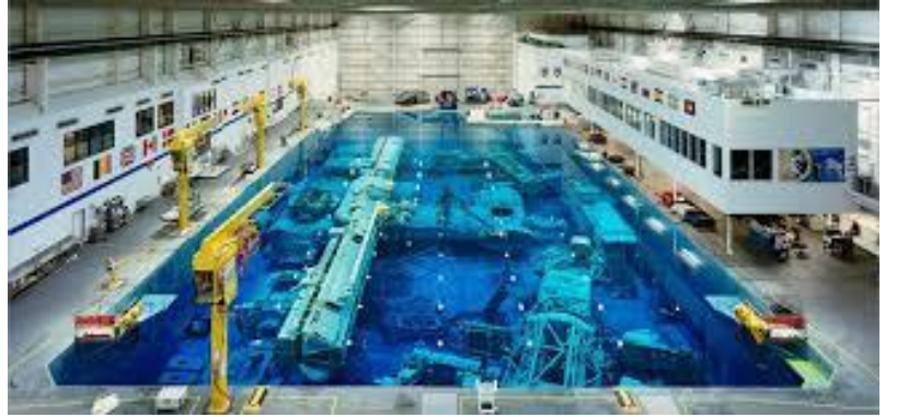
*Astronotların sualtı parkuru*

Sonra sıra gerçek boyutlu ve tümüyle işlevsel simülatörlerde uçuş kontrollerinden hidrolik kollara ve tuvalet kullanımına kadar her şeyin yoğun eğitimini almak üzere onlarca kullanım kılavuzunu ezberlemeye kalıyor. Her astronot adayı, fırlatma öncesi kontrollerden acil durum